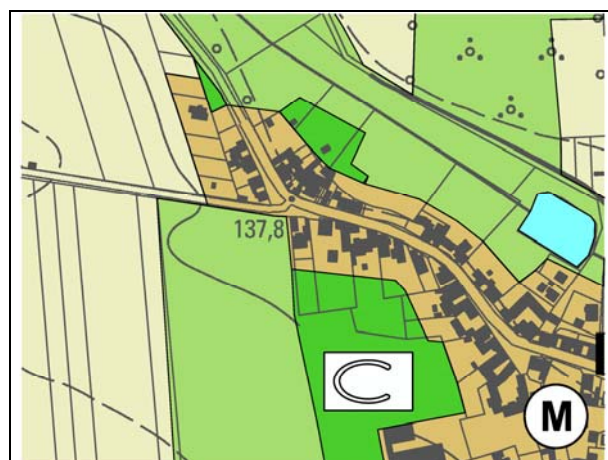
Ausschnitt aus dem Flächennutzungsplan der Verbandsgemeinde Flechtingen

[TK 10/2017] © LVermGeoLSA (www.lvermgeo. sachsen-anhalt.de/ A18-17108/2010