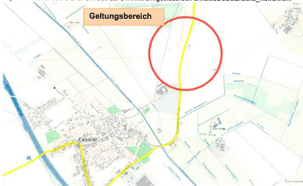
Darstellung der Sonderbaufläche Solar SPV - 1. Änderung Flächennutzungsplan

Topkarte © GeoBasis-DE/ LVermGeo LSA, www.lvermgeo.sachsen-anhalt.de/de/startseite_viewer.html