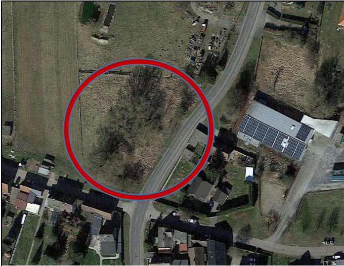
Luftbild Ostingersleben, Flur 4 Stand 2020 (die Gehölze sind inzwischen nicht mehr vorhanden)

Die Einbeziehung weiterer Flächen nördlich des Einbeziehungsbereiches wurde geprüft, diese werden jedoch im Bestand landwirtschaftlich genutzt.