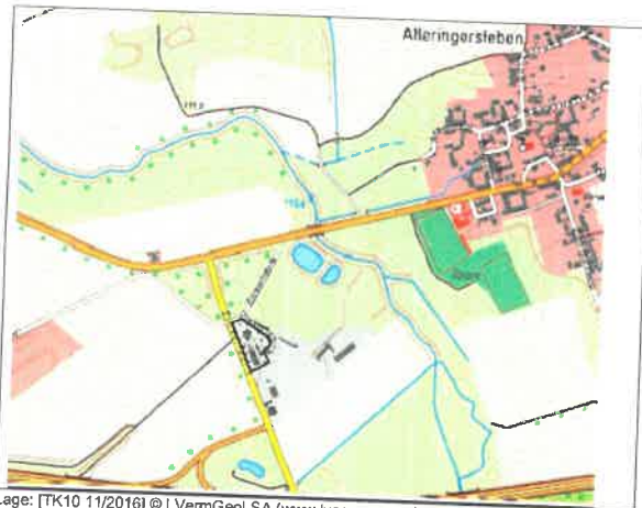
Lage des Plangebietes in der Gemeinde Ingersleben

Der Gemeinderat Ingersleben hat am 19.02.2024 die 1. Änderung und Ergänzung des Bebauungsplanes Gewerbegebiet „Alte Zuckerfabrik“ in Alleringersleben Gemeinde Ingersleben als Satzung beschlossen. Dieser Beschluss wird hiermit gemäß § 10 Abs. 3 des Baugesetzbuches (BauGB) ortsüblich bekanntgemacht. Mit dieser Bekanntmachung tritt die 1. Änderung und Ergänzung des Bebauungsplanes Gewerbegebiet „Alte Zuckerfabrik“ in Alleringersleben Gemeinde Ingersleben in Kraft.