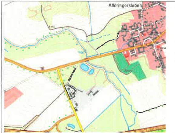
Lage des Plangebietes in der Gemeinde Ingersleben

Der Gemeinderat Ingersleben hat am 19.02.2024 die 1. Änderung und Ergänzung des Bebauungsplanes Gewerbegebiet „Alte Zuckerfabrik“ in Alleringersleben Gemeinde Ingersleben als Satzung beschlossen. Dieser Beschluss wird hiermit gemäß § 10 Abs. 3 des Baugesetzbuches (BauGB) ortsüblich bekanntgemacht. Mit dieser Bekanntmachung tritt die 1. Änderung und Ergänzung des Bebauungsplanes Gewerbegebiet „Alte Zuckerfabrik“ in Alleringersleben Gemeinde Ingersleben in Kraft.