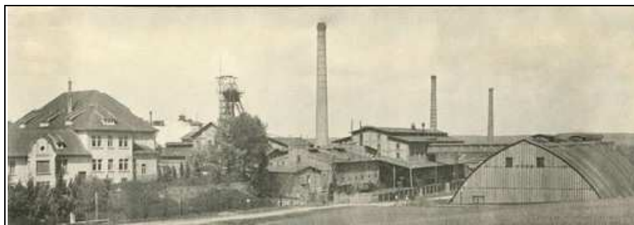
Foto des Geländes aus dem Jahr 1910

Bereits wenig später begann eine zunehmende Verlagerung der Abbautätigkeit in Richtung Morsleben, dessen Schacht im Jahr 1912 fertiggestellt wurde. Die Kali und Steinsalze wurden weiterhin in der Fabrik in Beendorf aufbereitet. Nach zwischenzeitlichen Produktionsunterbrechungen und teilweiser Nutzung des Schachtes zur Waffenproduktion im zweiten Weltkrieg und zur Hühnerhaltung nach 1945 wurde im Jahre 1969 die Salzgewinnung eingestellt und die Kali- und