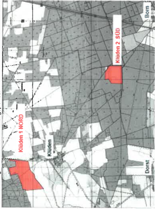
Übersichtskarte mit Darstellung der Plangebiete Klüden 1 NORD und Klüden 2 SÜD