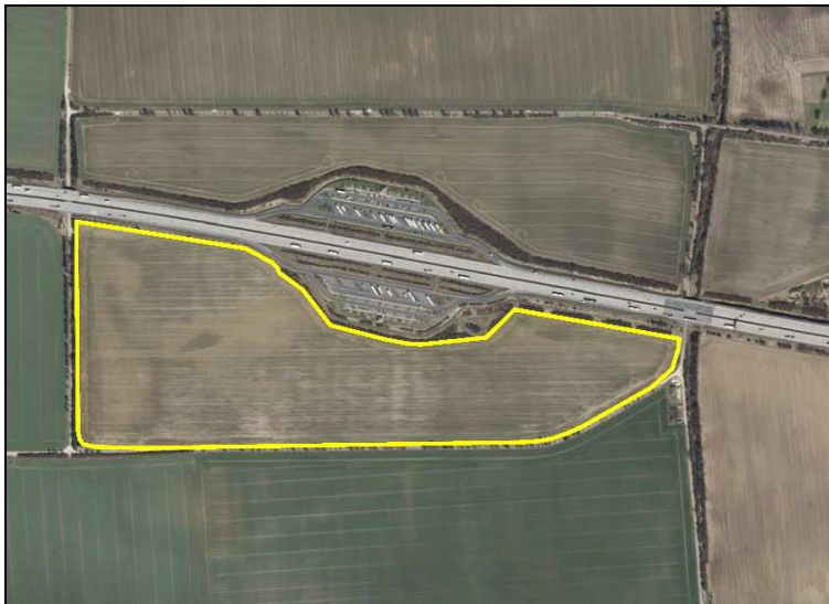
Luftbild der Fläche (Stand 2020)

[DOP 2020] © LVermGeoLSA (www.lvermgeo.sachsen-anhalt.de/ A18/1-17108/2010