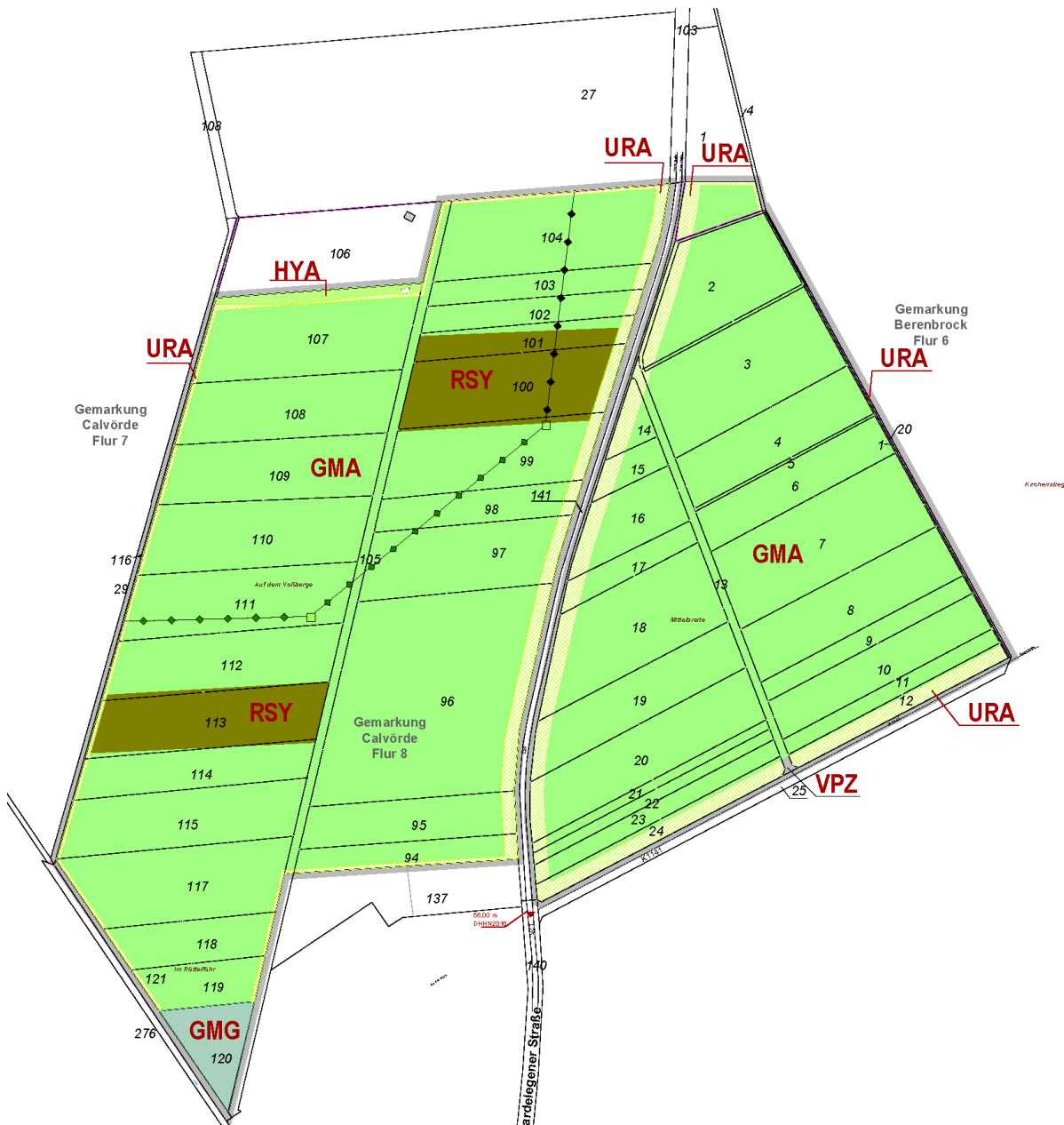
Abbildung 2: Biotopkarte des Planzustands

Die baulichen Anlagen der Freiflächen-Photovoltaikanlage können nicht in das bestehende Landschaftsbild integriert werden. Der Einfluss der Freiflächen-Photovoltaikanlage auf das Landschaftsbild soll durch die Bauweise der Solarmodule minimiert werden. Die Bauhöhen der baulichen Anlagen der Anlage überschreiten nicht 4,00 m. Ausgenommen von dieser Höhenbegrenzung sind Anlage zur Videoüberwachung der Photovoltaikanlage.